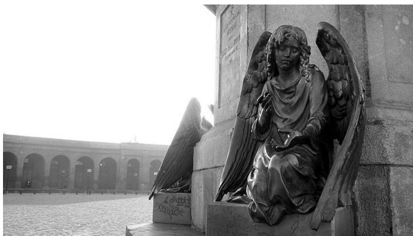
Esta foto se tomó el 21 de mayo, 2009 en Independencia, Santiago de Chile, con una Panasonic DMC-TZ5. Escultura de angel del escultor francés Carrier-Belleuse - Monumento a las víctimas del incendio de Iglesia de la Compañía en 1863 Avenida La Paz, Recoleta, Santiago.

Debemos comentar que, en varias fuentes, se asegura que la obra fue levantada frente a la ex placilla de la iglesia y que debió ser trasladada desde allí para la construcción del Palacio de los Tribunales de Justicia. Sin embargo, esto es un error: la ubicación del conjunto era la que hemos señalado, en los actuales jardines de Compañía con calle Bandera. Como hemos dicho, era el lugar que ocupara la Iglesia de la Compañía, o más precisamente el Altar Mayor. Después, los jardines del ex Congreso Nacional, llamados Plaza O'Higgins, fueron abiertos precisamente como parte del homenaje a las víctimas que allí encontraron la muerte en tan dramática situación.