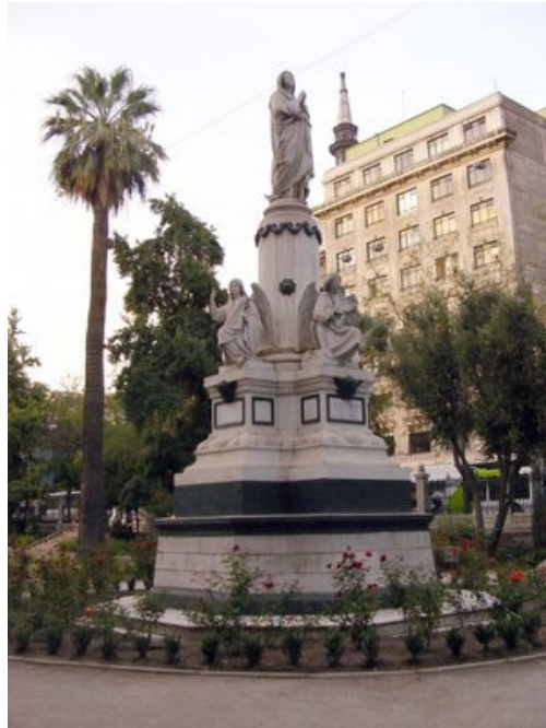
Vista actual del monumento en los jardines de la plaza.

Así pues, el conjunto original quedó repartido entre los dos monumentos. Y los dos, a su vez, son para las víctimas del incendio.