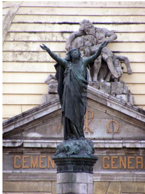
Acercamiento frontal a "La Dolorosa".

Octava Compañía del Cuerpo de Bomberos de Santiago "La Unión es Fuerza" Fundada el 30 de Diciembre de 1863