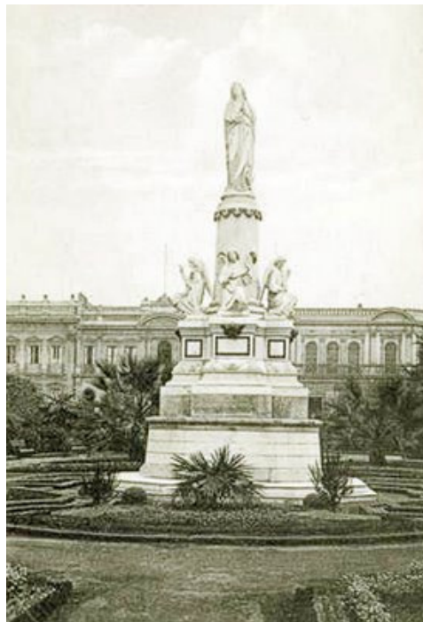
Postal antigua con el nuevo conjunto del monumento

Los jardines de la Plaza O'Higgins del ex Congreso están bellamente mantenidos, por lo que el monumento pasó a ser sólo la más visible de las piezas que allí se encuentran, existiendo varias otras estatuas y faros de gran esplendor artístico, provenientes de la casa francesa Val D'Osne, incluyendo una hermosa pileta. Árboles grandes, flores y palmas completan el jardín. En general, nada queda ya del horror que allí se viviera en 1863.