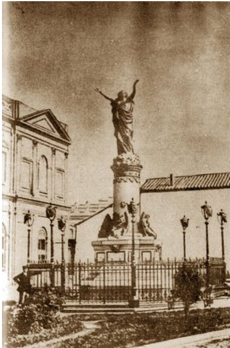
Imagen del primer monumento ("La Dolorosa") con su aspecto y ubicación originales.

www.octavabomberos.cl Bellavista # 594 Recoleta Santiago de Chile Fonos : 56 + 02 + 7375226 – 56 + 02 + 7374843