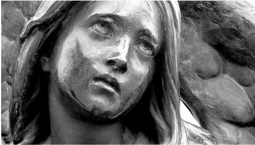
Escultura de Angel de "La Dolorosa" del escultor francés Carrier-Belleuse Monumento a las víctimas del incendio de Iglesia de la Compañía en 1863 Avenida La Paz, Recoleta, Santiago .

Esta foto se tomó el 21 de mayo, 2009 en Independencia, Santiago de Chile , con una Panasonic DMC-TZ5 .