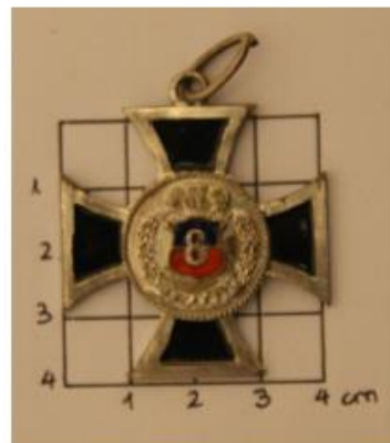
Medalla por 50 años