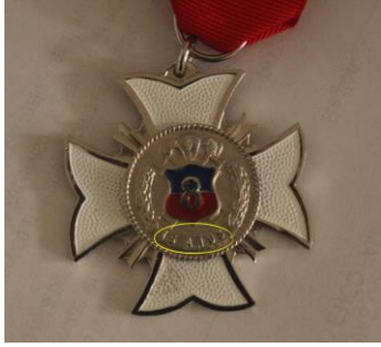
Medalla por 15 años