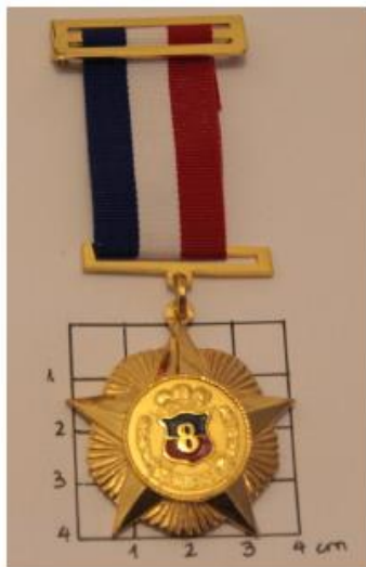
Medalla por 20 años