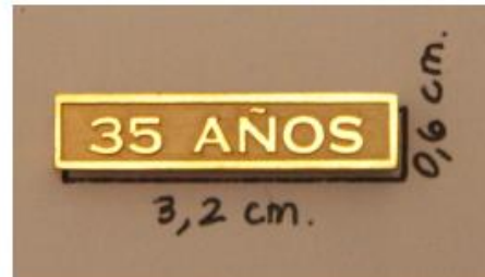
Barra por 25, 30, 35, 40, 45, 55 años en adelante.